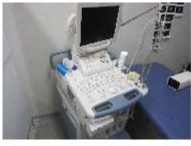
(写真)学内にある超音波診断装置

今月紹介する医療機器は、超音波診断装置です。エコーと言われれば、皆さんも聞いたことがあるのではないのでしょうか？超音波診断装置は、人が聞くことの出来ない音、超音波を発生させます。発信された超音波は、体内を伝わり、組織間で反射します。その反射した波をエコーとして受け取り、臓器の形などを読み取っています。エコー検査は、ガンの診断や心疾患、妊娠時の胎児の様子など幅広く使用されています。よく勘違いされがちですが、エコーとは超音波のことではなく、音波が物体に当たり反射する現象のことをいいます。例えば、山の頂上で大声を出した時の山びこも、一種のエコーなのです。ところで皆さんは、エコー検査の際、臨床検査技師の方が機器（プローブ）にジェルを塗っているとどこを見たことありますか？あれは超音波の通り道を確認しているのです。超音波は、